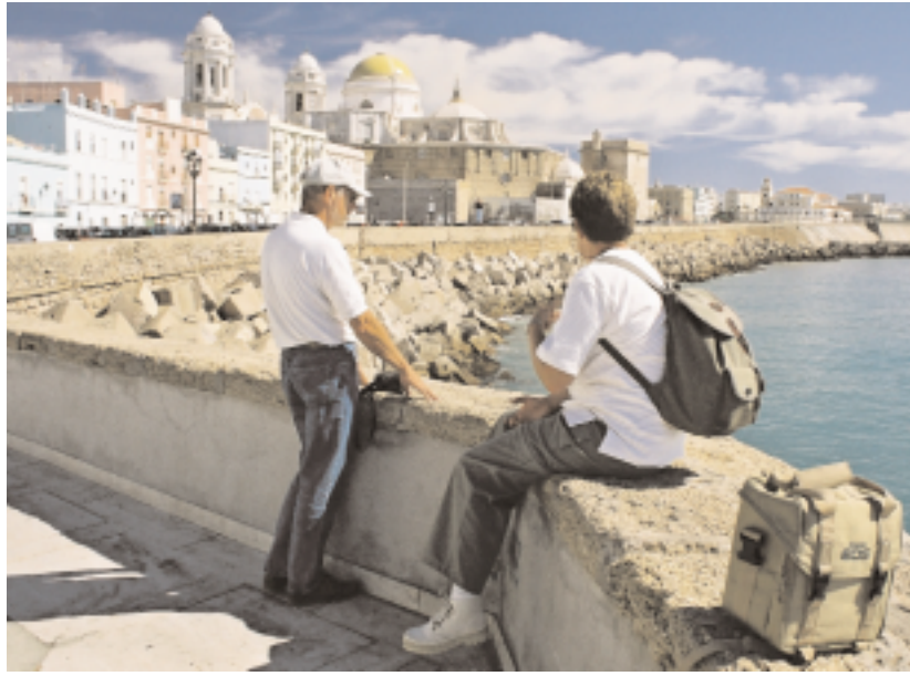
Archivo más pequeño que el formato de impresión - sin redimensionar