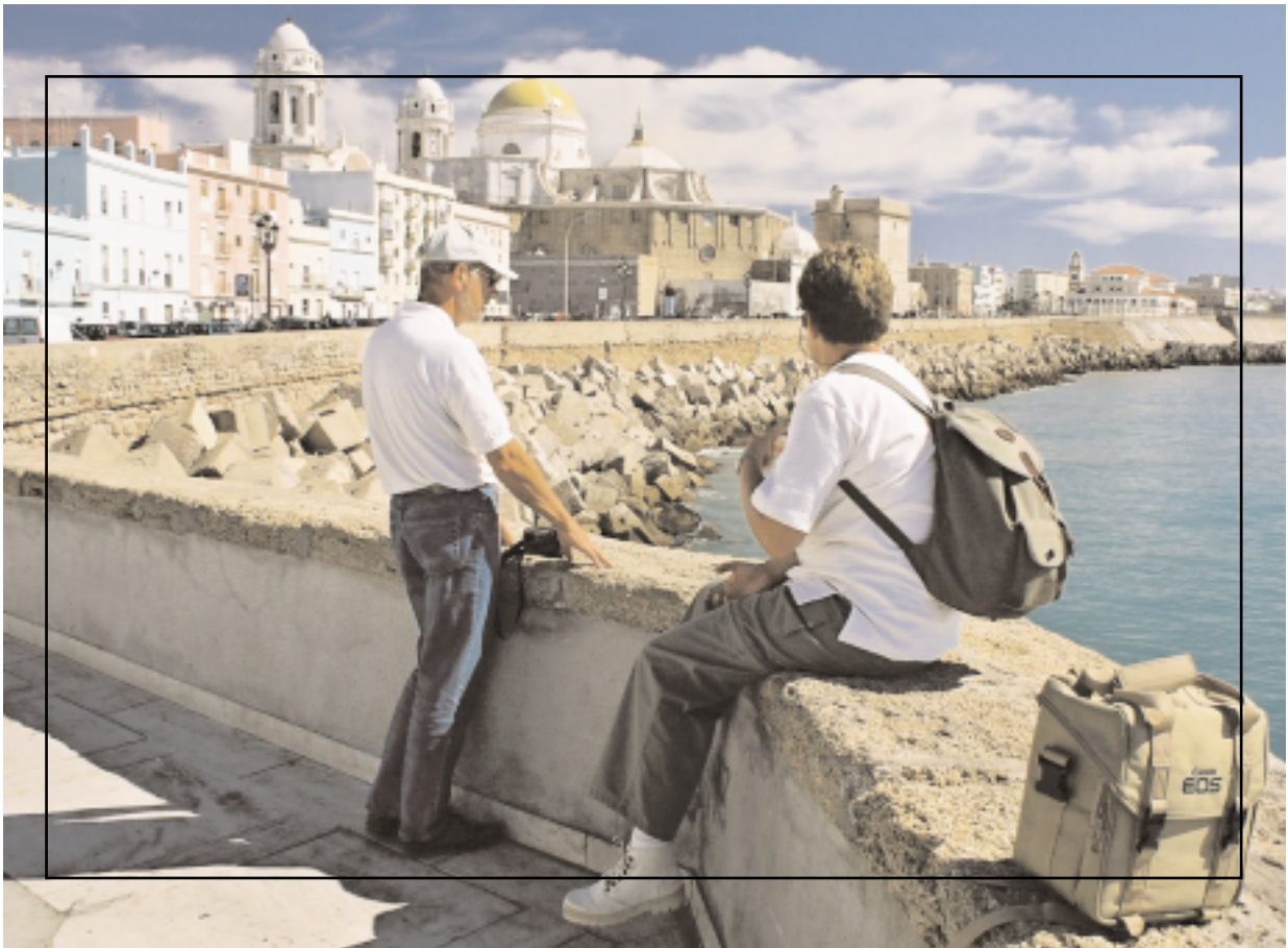
Archivo más grande que el formato de impresión - sin redimensionar